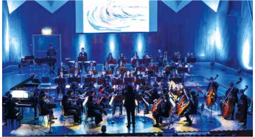
Foto oben rechts: Gemeinschaftliche Sinfonieorchester Gymnasium Trossingen & Droste-Hülshoff-Gymnasium Rottweil mit dem Motto "Rainbow - die Farbe der Musik"