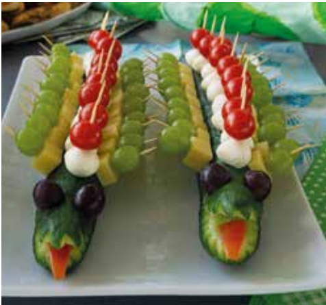
Fotos links: Jugendkapelle Bad Wurzach mit dem Motto "Juka – tierisch gut"